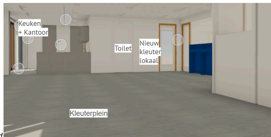
Inkijkje begane grond